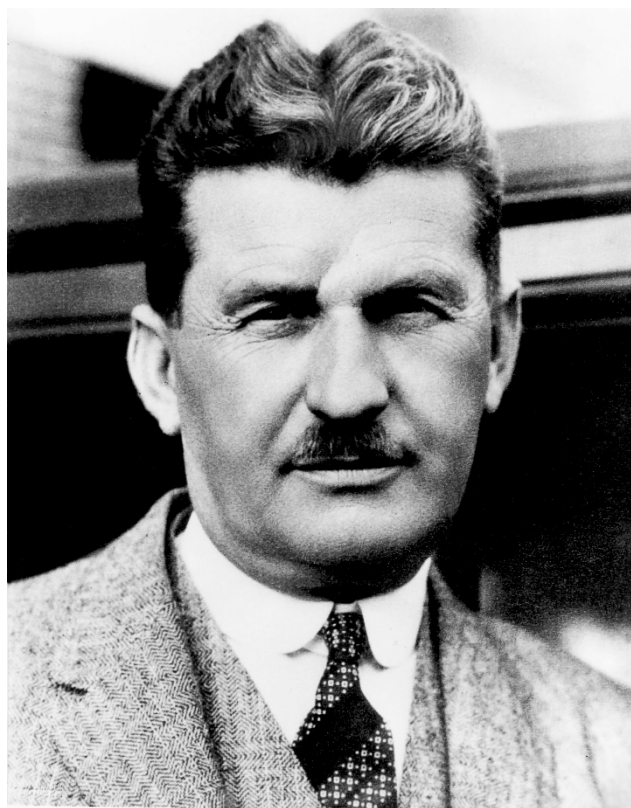
Tomáš Baťa, snímek z r. 1928-1929