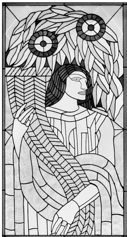
Vitráž podle návrhu Františka Kysely, Baťova vila ve Zlíně