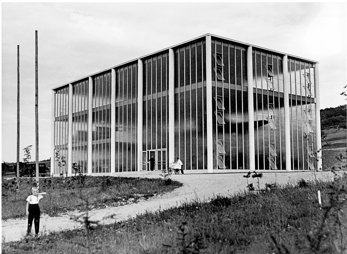
Památník Tomáše Bati ve Zlíně postavený r. 1933 podle návrhu Františka L. Gahury