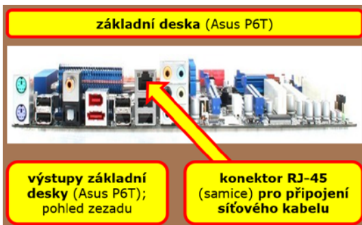
Obrázek č. 1.4: Základní deska; výstupy (pohled zezadu)