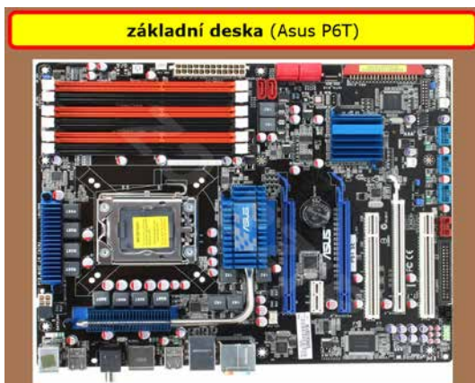
Obrázek č. 1.3: Základní deska s integrovanou sítovou kartou