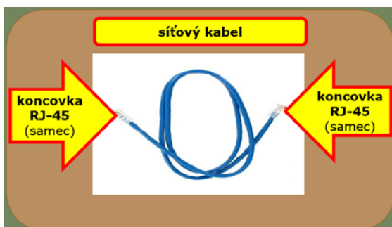
Obrázek č. 1.6: Síťový kabel

Pro kabelové připojení potřebujete síťový kabel s koncovkami RJ-45 (viz obr. č. 1.6). Tento si můžete koupit (v požadované délce a můžete si vybrat i barvu), nebo vám ho zhotoví v počítačovém obchodě. Síťový kabel zasunete do slotu síťové karty tak, až zacvakne pojistka (pozor při odpojování: musíte nejdříve uvolnit západku).