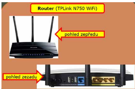
Obrázek č. 1.7: Router; TP-Link

lové tak i Wi-Fi připojení (viz obr. č. 1.7). I když je k němu přidán návod (na DVD) a většinou se (pro základní nastavení) jedná jenom o použití průvodce, přece jenom byste zprovoznění routeru měli nechat na někom zkušenějším a v této činnosti zběhlejším.