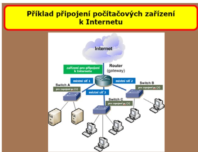
Obrázek č. 1.1: Připojení počítačů k internetu 3

Druhým typem počítačů v síti jsou jednotlivé pracovní stanice, které jsou, samozřejmě, napojeny na svůj server. Jednotlivý počítač se obvykle nazývá slovem klient – je to ten, kdo služby serveru přijímá.