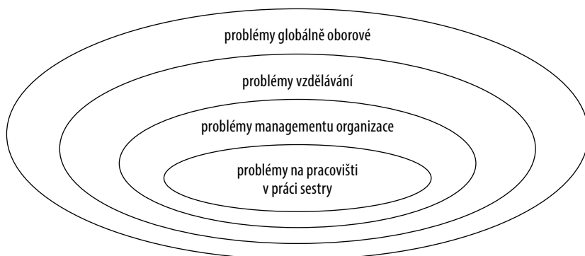
Obr. 1 Grafická hierarchická struktura pro přepis a vyhodnocení dat

Získané informace od respondentek byly po pečlivém prostudování strukturovány do 4 základních kategorií – podle oblastí, ve kterých respondentky identifikovaly problémy. Byly stanoveny kategorie: problémy na pracovišti v práci sester – problémy managementu organizace – problémy vzdělávání – problémy globálně oborové (obr. 1).