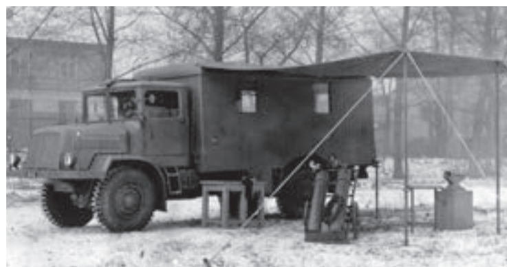
T 128: automobilní pojízdná dílna typ „B“, ev. č. 48512 [1]