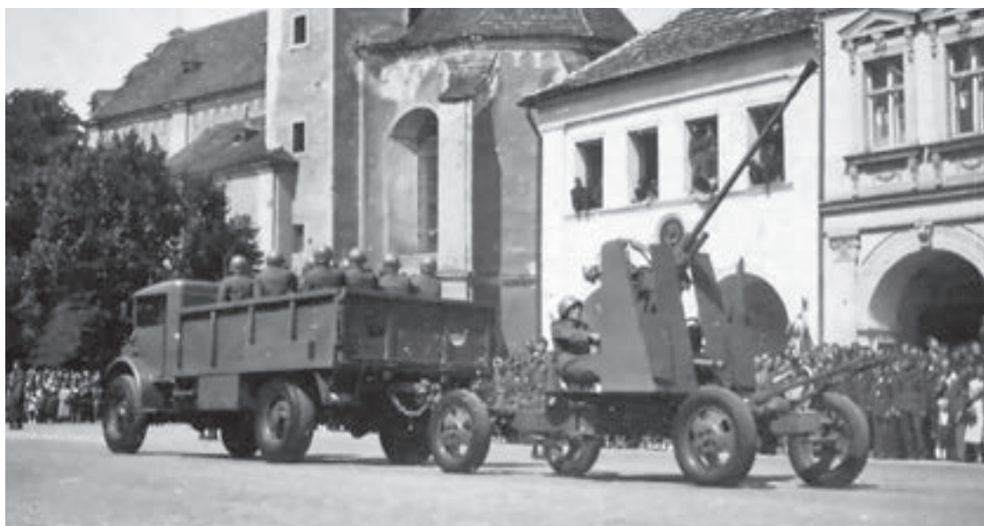
Ford Canada F-60 (ev. č. 141561) s 37mm protiletadlovým kanónem vz. 39 na přehlídce v Domažlicích (1951)

vozidla však nebyla v úplném a dobrém technickém stavu, naproti tomu vojenská správa byla nucena při výměně předávat vozidla pojízdná a s náhradními součástkami. V důsledku těchto kroků se zvýšil k 1. lednu 1952 koeficient technické pohotovosti. V roce 1952 ještě proběhla výměna 150 kusů vozidel, čímž se možnosti doplnění automobilů z civilu vyčerpaly.