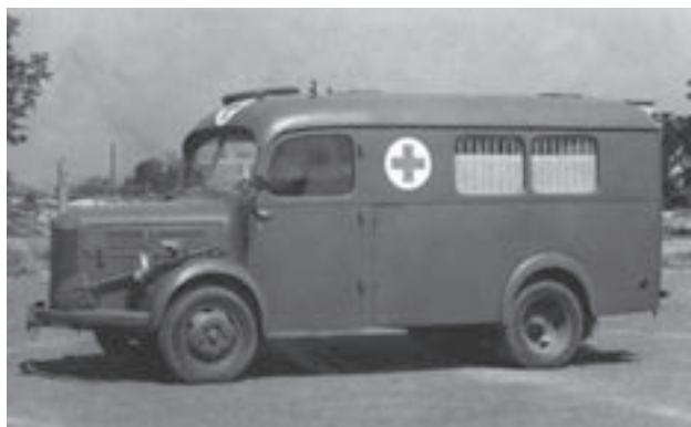
A-150: čtyřlůžkový zdravotnický automobil