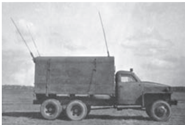
Studebaker SCR 399: radiovůz z výzbroje Českosloven- ského armádního sboru v SSSR

typů vozidel, zařazených v jednotlivých složkách ozbroje- ných sil, bylo pro jejich udržení v provozu zapotřebí více než 300 000 různých náhradních součástí a příslušenství. Po vyčerpání kořistních skladů se tyto automobily staly z velké části nepojízdnými, výroba náhradních dílů v tu- zemsku nemohla být pro nízké počty jednotlivých typů re- alizována. Na základě těchto skutečností se automobilový park stal postupně nespolehlivým.