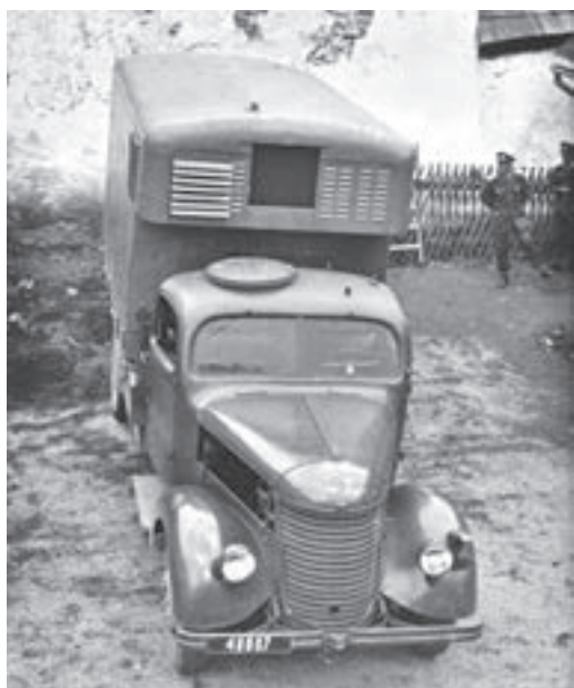
Praga RN: chladič přepravník masa

strukci podvozku s žebřinovým rámem a vzduchem chlazeným vznětovým motorem. Takový automobil však žádný z domácích výrobců ve své nabídce neměl. Vojenská správa až do roku 1950 dostávala z výroby pouze běžná silniční vozidla s nepatrnými úpravami, která nemohla zajistit potřeby vojsk (např. Praga RN, RND, Aero A-150). I přes určitý pokrok v modernizaci našich ozbrojených sil bylo jejich využití především v terénu minimální.