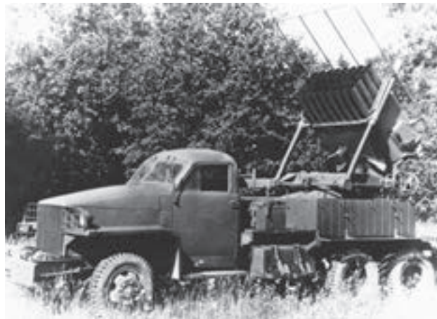
Studebaker se 130mm raketometem vz. 51 (ev. č. 44557)

Převážnou část automobilní techniky používané armá- dou tvořily kořistní typy, které v důsledku špatného tech- nického stavu a nedostatku náhradních dílů způsobovaly při používání značné těžkosti. Pro více než 800 kořistních