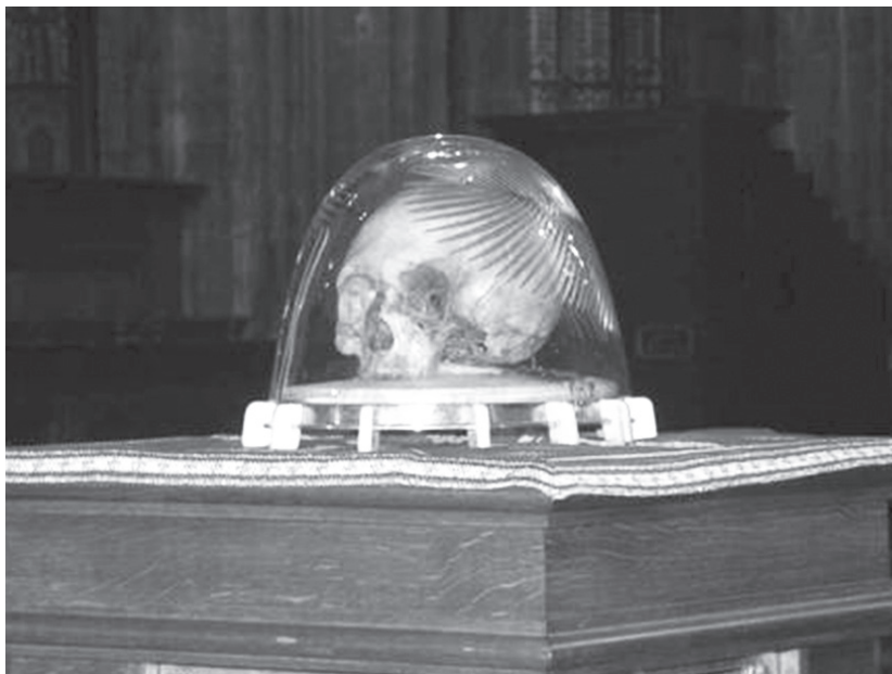
Lebka sv. Vojtěcha ve Svatovítském chrámu

a kritizoval všechny pohanské a nekřesťanské přežitky jako otroctví, mnohoženství, incest atp., ale jeho kroky nebyly příliš populární a Vojtěch Prahu opustil, aby se na naléhání o několik let později vrátil a dal rodné zemi ještě jednu šanci; přišel dokonce pěšky a bos jako pravý kajcník. Roku 993 založil Břevnovský klášter, první mužský klášter v Čechách, avšak štěstí mu opět nepřálo, navíc v září roku 995 byla vyvražděna jeho rodina, což jistě jen podpořilo jeho úmysl odejít na dobro.