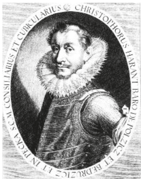
Kryštof Harant z Polžic a Bezdružic na dobové rytině

to vlastně zoufalý chudák, odsouzený bojovat o svou moc. I takové jsou někdy císařské osudy.