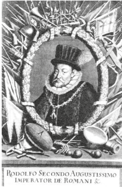
Rudolf II. na mědirytině Jiljího Sadelera

noty bratrské, císařem postavené před sedmi lety mimo zákon. Rudolf, který byl ve vleku katolické strany v čele s kancléřem Zdeňkem Vojtěchem Popelem z Lobkovic, Vilémem Slavatou a Jaroslavem z Martinic, však manévroval, vyhýbal se přímým jednáním, sliboval a zase odvolával. V Praze se zatím dramaticky vyhrcovala situace. Stavý svolaly na 5. květen na Novoměstskou radnici zemský sněm. Císař ho sice zakázal, ale sněm se přece sešel, a Rudolfovi nezbylo, než ho 24. května legalizovat. Odmítl však přistoupit na požadavky nekatolické šlechty požadující náboženskou svobodu. Tím jen přilil oleje do ohně.