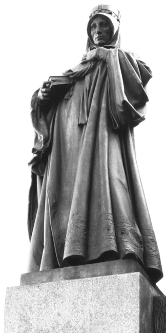
Josef Václav Myslbek (1848–1922): Svatá Ludmila v sousoší sv. Václava na Václavském náměstí

Bořivojovo výlučné mocenské postavení zřejmě zajišťovala i moravská vojenská družina, kterou mu dal k dispozici velkomoravský panovník Svatopluk. Bořivoj tak v Čechách hájil zájmy vladaře Velké Moravy, jemuž se cítil být