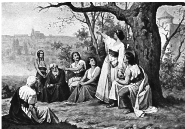
Josef Mathauser (1846–1917): Libuše věští slávu Prahy

Libuše a Přemysl Oráč se museli znát už dříve, ještě když Libuše žila na svém hradišti v Libušíně. Stará pověst, zaznamenaná Kosmou, totiž praví, že Libuše českému poselstvu přesně určila, kam se má pro jejího budoucího chotě vypravit: „Hleďte,“ praví, „hle za oněmi horami“ – a ukázala prstem na hory – „je neveliká řeka Bielina (dnešní Bílina) a na jejím břehu je viděti vesnici, jež slove Stadice...“