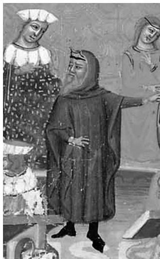
Kníže Svatopluk v Dalimilově kronice

V tomto směru nemohl Bořivoj I. franckým a velkomoravským vladařům konkurovat, avšak měl jednu nepopiratelnou výhodu. Česká kotlina byla chráněna téměř ze všech stran pásem hor, které vytvářely přirozený obranný val