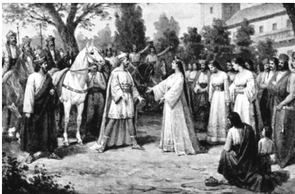
Josef Mathauser (1846–1917): Libuše vítá Přemysla

gundského mnicha Fredegara ( Historia Francorum ; psaná od roku 583), která je hlavním pramenem informací o Sámovi a jeho slovanských kmenech, obecně nazývaných Venedové. Zda mezi ně patřil i kmen Čechů, není známo, odborné názory se velmi různí.