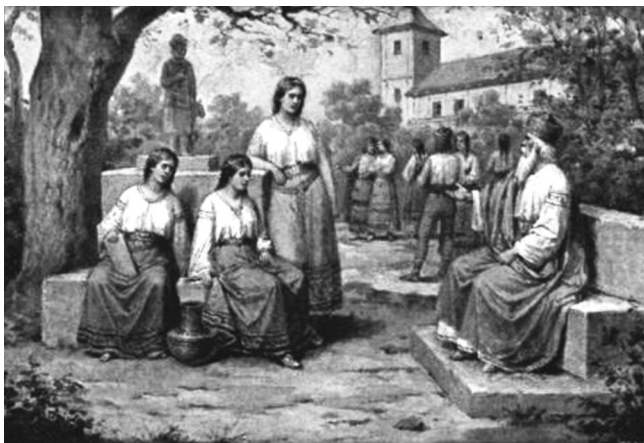
Josef Mathauser (1846–1917): Kníže Krok s dcerami Kazi, Tetou a Libuší

Možná právě to byl okamžik, který Libuši nahrál, protože kdo jiný měl odvrátit neštěstí, když ne vědma. Kristián však o Libuši nemluví jako o kněžně, dokonce neuvádí ani její jméno, pouze se zmiňuje o „hadačce“, k níž se moudří mužové chodili radit.