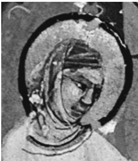
Vyobrazení sv. Ludmily v Dalimilově kronice ze čtrnáctého století

K něžna Ludmila je významnou postavou českých dějin z několika důvodů. Ačkoli o ní nemáme dostatek zpráv a o jejím životě se dozvídáme kusé informace především prostřednictvím pozdější církevní legendistiky, byla to žena zcela výjimečného postavení, jímž po několik desetiletí spoluurčovala osudy raně feudálního českého státu na samém jeho počátku. Nepochybně proslula i jako obhájkyně christianizace vzrůstajícího se českého knížectví, jež vzniklo na troskách rozvrácené Velkomoravské říše, kterou zahubily po smrti jejího krále Svatopluka vnitřní rozbroje, doprovázené ničivými nájezdy kočovných Maďarů.