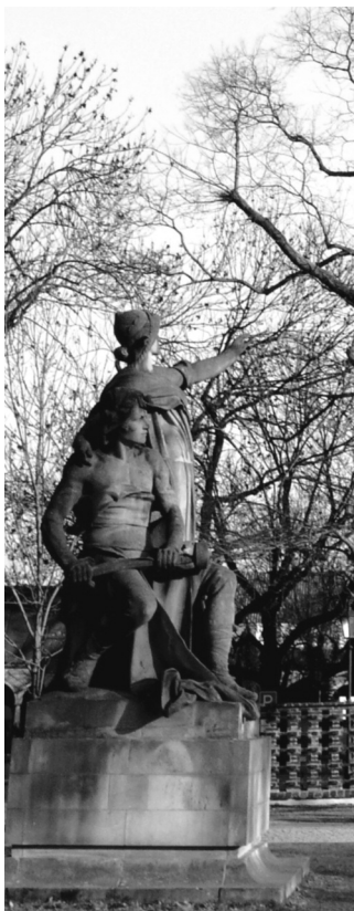
Josef Václav Myslbek (1848–1922): Přemysl s Libuše. Originál, tvořený v letech 1881–1890, umístěný u Palackého mostu, byl zničen při náletu v únoru 1945, kopie sousoší je v parku u vyšehradské baziliky sv. Petra a Pavla od roku 1978

nosti byl Přemysl kmenový vůdce, který předsedal kmenovému shromáždění, tvořenému vladky jednotlivých rodů a sousedních kmenů, které uznávaly vůdčí roli Čechů. Kolik těchto kmenů však v sedmém století bylo, o tom se můžeme jen dohadovat, nicméně v té době už vznikaly zárodky budoucích kmenových společenství s centrální správou, jako byli například Lučané na Žatecku, Zličané na Kouřimsku, nebo Pšované na Mělnicku. Ve východních Čechách pak sídlili Charváti, z nichž později povstal vládnoucí rod Slavníkovců.