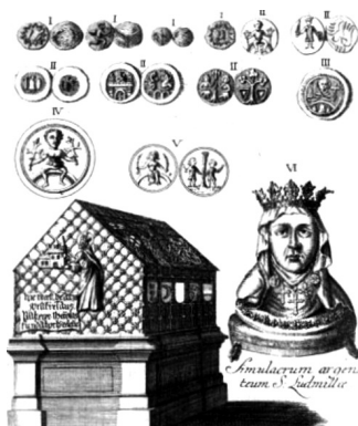
Václav Hájek z Libočan (?–1553): Relikviář sv. Ludmily (Kronika česká)

V té době totiž Svatopluk ovládl značnou část české kotliny a vybral si Bořivoje jako svého „místodržitele“. Při výběru jistě přihlížel i k tomu, že Bořivoj ovládal strategicky cenné