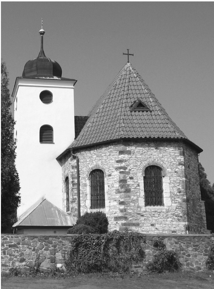
Kostel sv. Klimenta na Levém Hradci