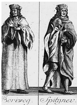
Václav Hájek z Libočan (?–1553): Bořivoj a Spytihněv (Kronika česká)