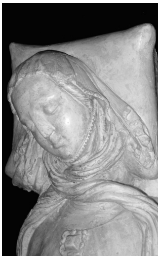
Detail nábrobku sv. Ludmily v bazilice sv. Jiří na Pražském hradě

Ludmilinou násilnou smrtí se v českém knížectví vytvořila nová situace a sousední německý král Jindřich Ptáčník se jistě musel ptát, zda nová česká vládkyně půjde v Ludmiliných stopách jako jeho spojenec. Ke změně na českém knížecím stolci došlo bez jeho přičinění. Věděl, že se novou českou vládkyní stala žena z jednoho kmene Polabských Slovanů, s nimiž vedl válku, a proto se rozhodl, že nic neponechá náhodě.