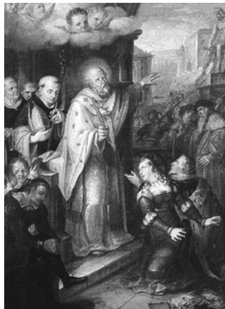
Václav Ignác Leopold Markovský (1789–1846): Křest knížete Bořivoje