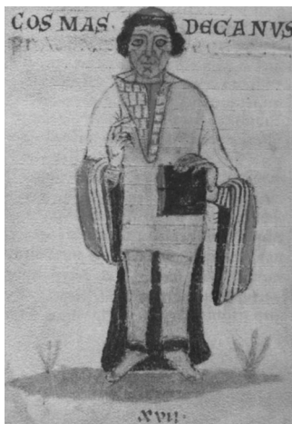
Kosmas (1045–1125), děkan pražské kapituly při sv. Vítu, autor Kroniky české (Chronica Boemorum), vyobrazený v opisu Lipské kroniky ze čtrnáctého století

skutečně bylo staroslovanské hradiště. Ostatně odtud bylo blíž do Stadic, kde si Libuše vyhlédla budoucího chotě Přemysla Oráče. Pod zbytky libušinského hradiště archeologové objevili stopy po ještě starší osadě, snad ze šestého století, tedy v podstatě z časů, kdy tady měla Libuše působit.