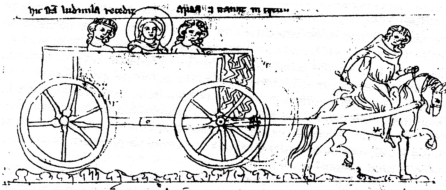
Odjezd kněžny Ludmily z Prahy (Velislavova bible, čtrnáctého století)

Zda a jak se s touto správou Moravanů českého knížectví vyrovnalo české obyvatelstvo, není jasné, ale vzhledem k Stroj mírovu povstání proti Bořivojovi, se to asi neobešlo bez problémů. Svatoplukova smrt však všechno změnila.