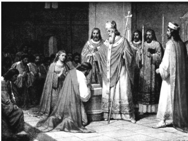
Josef Mathauser (1846–1917): Arcibiskup Metoděj křtí českého knížete Bořivoje a jeho manželku Ludmilu

zavázán za jeho pomoc, s níž odrazil francké interventy. Následný sňatek se Slaviborovou dcerou zaručoval, že měl na své straně i vládce Pšovů, o němž historici soudí, že uznal Bořivojovu mocenskou nadřazenost a snad se stal jedním z vlivných velmožů jeho knížecího dvora. Oba vládcové mohli také nyní počítat se vzájemnou vojenskou podporou, s níž by odvrátili útok jakýchkoli vetřelců.