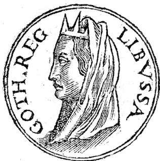
Fiktivní portrét kněžny Libuše v Promptuarii Iconum Insigniorum z roku 1553

mytickou paměti prvního historicky doloženého vládnoucího panovnického rodu v Čechách, tedy Přemyslovců, jejichž dynastie se v čele českého státu prokazatelně udržela více než čtyři století. Pokud bychom chtěli zohlednit i dobu vlád Libušiných a Přemyslových nástupců, museli bychom přičíst sto až sto padesát let s knížaty Nezamyslem, Mnatou, Vojenem, Vnislavem, Křesomyslem, Neklanem a Hostivitem, jejichž výčet uvedl děkan pražské kapituly Kosmas v latinsky psané kronice Chronica Boemorum (psána v letech 1119–1125), nejstarším spisu k českým dějinám; historicky však nejsou doloženi.