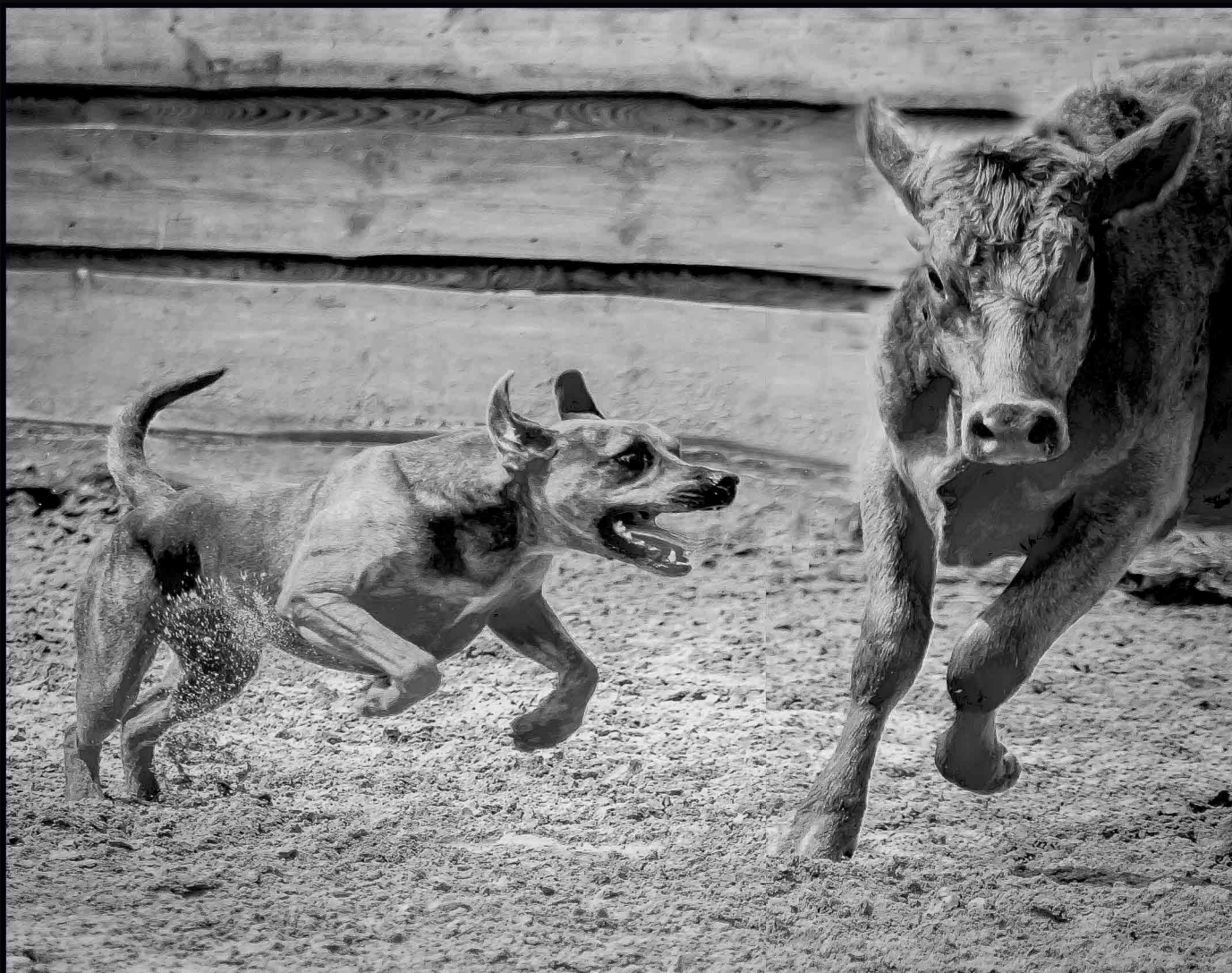
Útok a útěk

Kontrast se objevuje v každém snímku a vždy v jiné roli. Měli bychom ho vnímat již při výběru námětu a zvolit takové kompoziční řešení, aby jeho obrazová role byla v souladu s obsahem snímku.