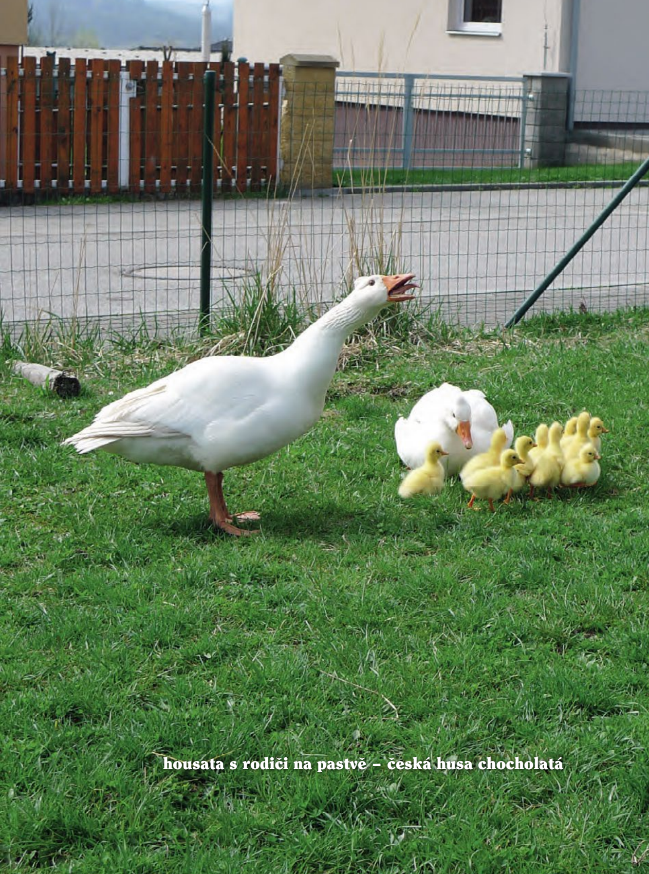
housata s rodiči na pastvě - česká husa chocholátá