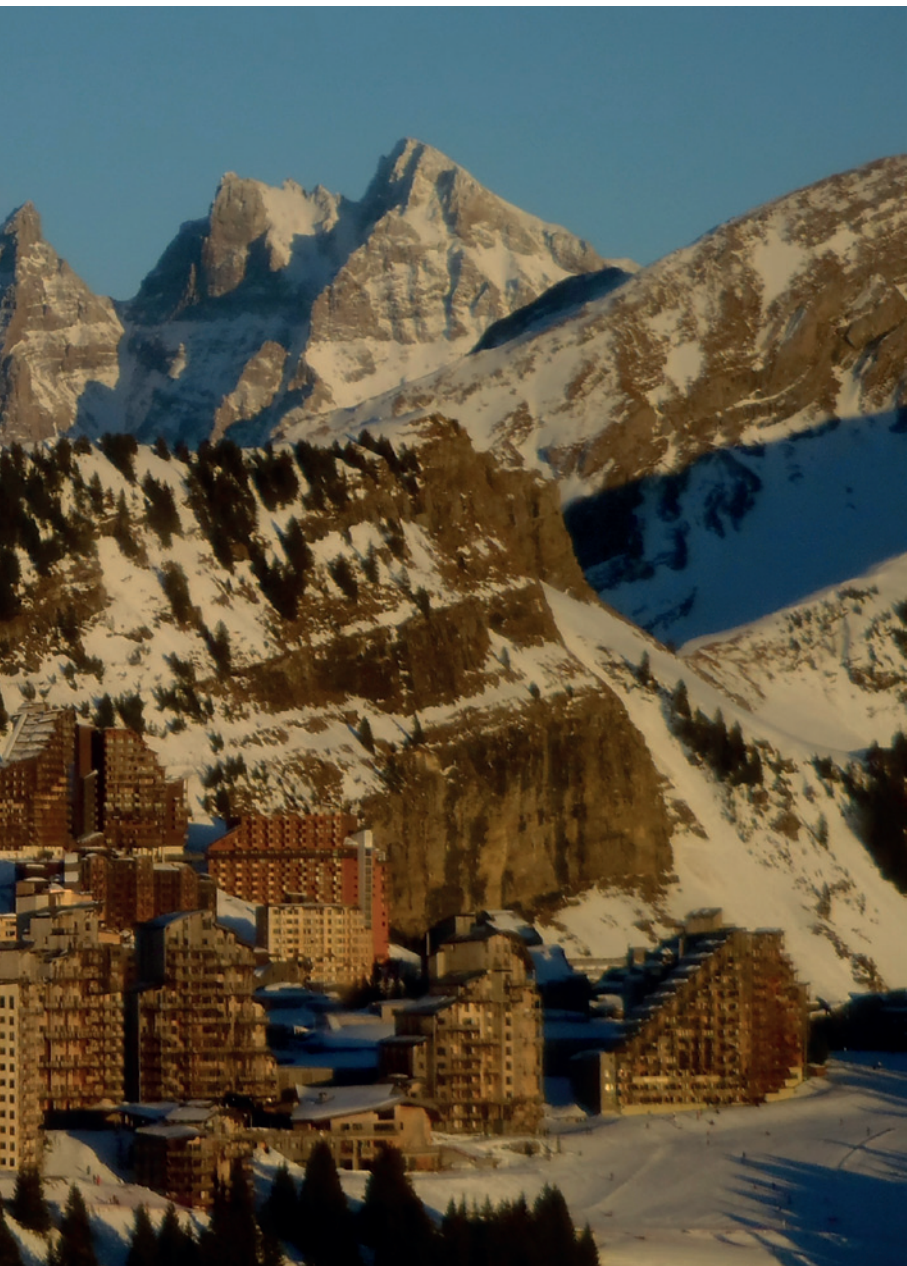
Lyžařské středisko Avoriaz