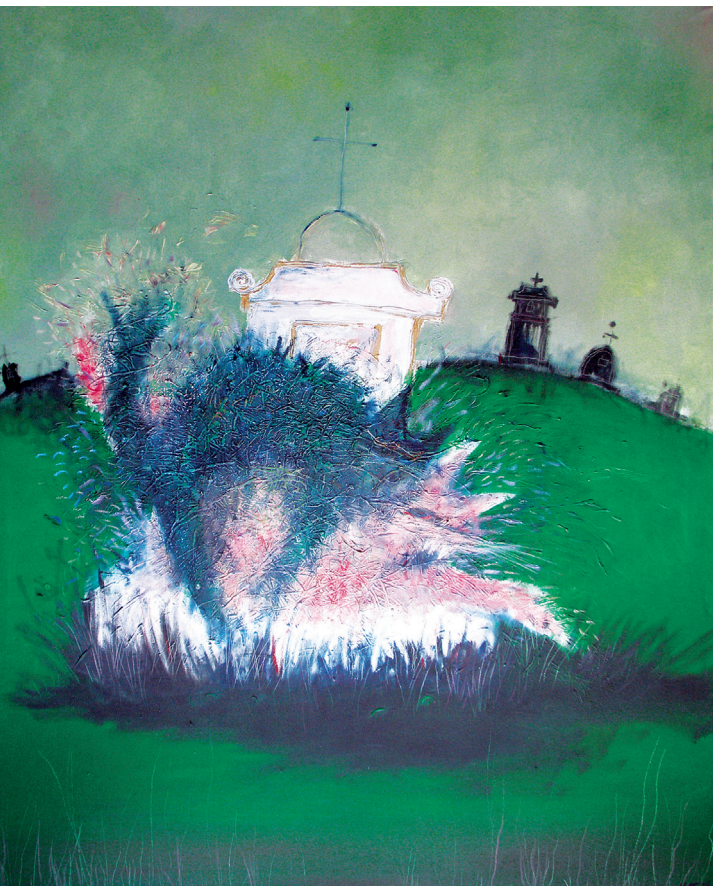
Marek Brodský: Mrouskání na krchově (2006)