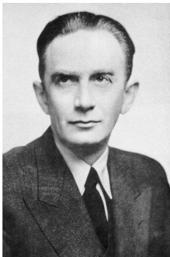
Walter Krivickij, generál GRU, který utekl Stalinovi

Od skončení Velké války, kterou německé císařství prohrálo a muselo draze platit reparacemi, byla země politicky a hospodářsky rozvrácená. Vedení komunistické strany v roce 1923 usoudilo, že je vhodná doba k zahájení socialistické revoluce, a moskevská