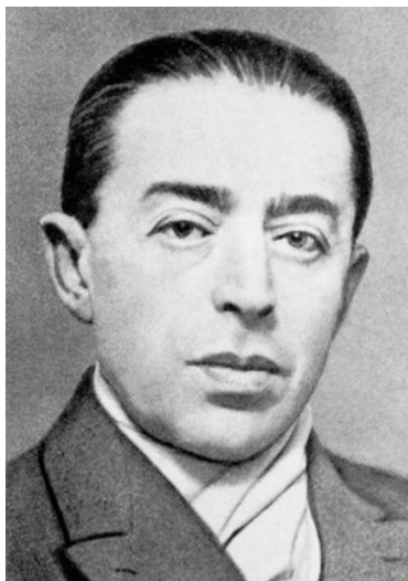
Sidney Reilly měl pro tajnou službu MI6 jako největší znalec Ruska mezi agenty obrovský význam.

Velkou Británii znepokojovalo německé zbrojení. Výzvědná služba Reillymu nabídla, aby se vypravil zjistit skutečný stav. Pořídila mu osobní dokumenty na jméno pobaltského Němce Karla Hahna a zařídila několikadenní kurz sváření.