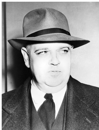
Whittaker Chambers, americký exkomunista, který opustil síť komunistických špiónů

nemůžeme odejít z boje. Stalin se může mýlit, Stalinové přicházejí a odcházejí, ale Sovětský svaz zůstává. Máme povinnost zůstat v boji.“