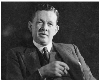
Britský generální konzul v Moskvě Robert Bruce Lockhart byl, jako většina profesionálních diplomatů, spjatý s tajnou službou.