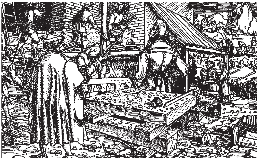
Obr. 2.5 Stavební huť z 1. pol. 16. stol. (Hans Burgmair)