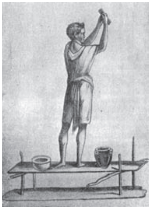
Obr. 2.2 Římský zedník upravující omítku dřevěným nástrojem (nástěnná malba v Pompejích)

cevrstvé, zejména pokud sloužily jako podklad pro nástěnné malby. Takové omítky lze nalézt nejen v Pompejích a Herculaneu, ale také v dochovaných zbytcích římských staveb v provinciích, např. na území dnešního Švýcarska. Zde byly nalezeny jádrové omítky o tloušťce 6 mm, plněné převážně cihlovou drtí a na nich jemná štuková vrstva 2 mm silná (Vindonissa v Aargau), ale také i omítky o síle 20 až 30 mm jádra, v němž je plnivem křemenný písek o velikosti zrn až 9 mm. Povrch těchto jádrových omítek se upravoval zdrsňením ozubenými nástroji, aby se další vrstvy pevněji vázaly. Není výjimkou, je-li jádrová vrstva armována přírodními materiály, pazdeřím palmovými vlákny, trávou, rákosem či zvířecími chlupy. U všech omítek, které sloužily jako podklad pro nástěnné malby, se nachází silně hlazený, často až leštěný povrch ( obr. 2.2 ). Jak dokazují