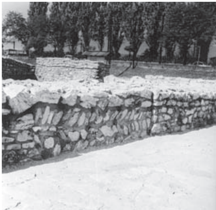
Obr. 2.1 „Opus spicatum“, zbytky římských staveb (Aquincum, Budapešť)