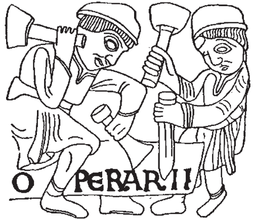
Obr. 2.3 Opracovávání kvádrů pomocí špičáku a plochého (šarírovacího) dřeva (románský reliéf z Maastrichtu 1180)

Kvalitě omítek se také napomáhalo velmi pečlivým hašením vápna. Empirickými zkušenostmi se přišlo na to, že kvalitu vápna ovlivňuje přímo při výhasu přítomnost látek s povrchově aktivním účinkem, ponejvíce roztoků s obsahem alkoholu nebo zmýdelnitelných tuků. Ty totiž usnadnily dokonalé prohašení vápenné kaše až do nejmenších částic a bránily vytváření koloidních agregací nebo i větších spečených a neprohašených kongrecí. Proto se při hašení vápna přidávalo pivo, víno, jablečný mošt, ale také lůj či jiné organické tuky. Protože každý technologický proces byl ve středověku přísně chráněným tajemstvím a v Byzanci to platilo dvojnásob, byly tyto postupy proměněny v rituál, v němž se původní praktický účel již nedal vysledovat. Některé dosti kuriózní postupy se dlouho tradovaly, např. obřad, při kterém se do jámy s vápnem házela mrtvá zvířata, zejména kočky. Postup hašení rozeznával několik variant a to z hlediska účelu, na které mělo být vápno použito. Na příklad uhličitanové vápno, vhodné pro vnější omítky se připravovalo tak, že se vyhašené vápno shrabalo do kupek, ty se přikryly kravskými nebo ovčími kůžemi a nechalo přes zimu vymrznout. Vápno se jednak působením vzdušného oxidu uhličitého na povrchu částečně přeměnilo na uhličitan vápenatý, jednak se mrazem opět rozrušily přítomné kongrece. Takto upravené vápno se