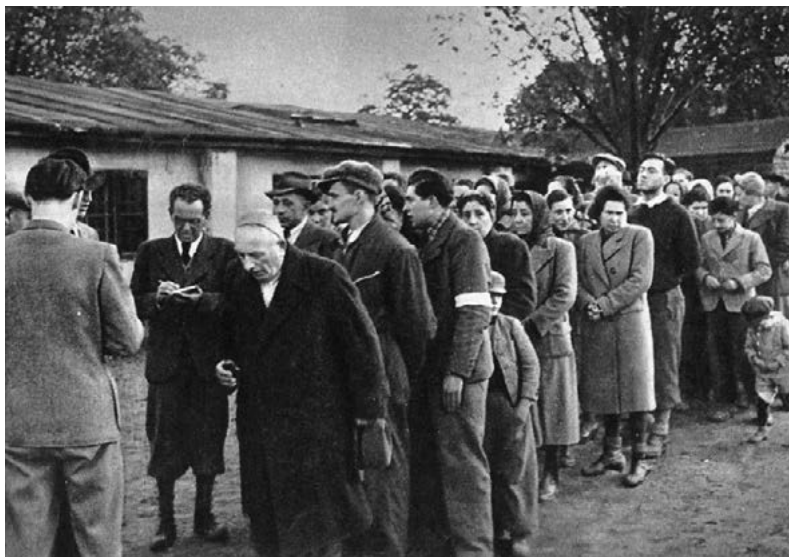
Sběrný tábor Žilina, 1942.

kteřá v té době nebyla majetkem města, ale ministerstva obrany.