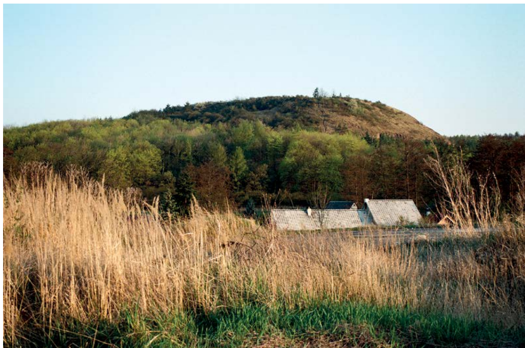
Rubín u Podbořan

vzkázal sebevědomý slovanský náčelník poslovi žádající poddanost avarskému kaganátu (s centrem v Panonii). Vedle toho zejména pohřební nálezy dokládají mírové soužití obou etnik a též vzájemné oboustranné ovlivňování a prolínání jejich kultur.