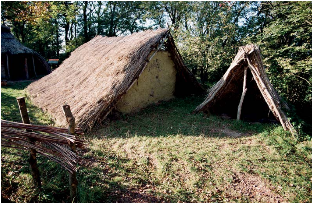
Skansen prvních Slovanů v Březně u Loun

Tohoto roku [631] Slované, zvaní Vinidové, povraždili v Sámově království frankké kupce s četnějším doprovodem a oloupili je o majetek a to byl počátek rozepře mezi Dagobertem a Sámem, králem Slovanů. I vyslal Dagobert k Sámovi vyslance Sicharia se žádostí, aby přikázal poskytnout spravedlivou náhradu za kupce, které jeho lidé povraždili nebo jejichž majetku se protizákonně zmocnili. Protože Sámo nechtěl Sicharia spatřit a nedovoloval mu, aby k němu přišel, oblékl si Sicharius šat, jaký nosí Slované, předstoupil se svým doprovodem před Sáma a oznámil mu všechno, co měl uloženo. Ale jak to bývá znakem pohanství a zpupnosti nešlechtných lidí, Sámo nedal náhradu za nic z toho, čeho se jeho lidé dopustili, a chtěl pouze stanovit soudy pro tyto a jiné spory, které vznikly mezi oběma stranami, aby bylo navzájem uplatněno právo. Sicharius – jako pošetilý vyslanec – pronese potupná slova, která mu nebyla uložena, a hrozby proti Sámovi, že totiž Sámo i lid jeho království jsou Dagobertovi povinni poddanstvím. Sámo, již uražen, odpověděl: „Jako země, kterou máme, patří Dagobertovi, tak i my jsme jeho, pokud jen bude mít v úmyslu zachovávat vůči nám přátelství.“ Sicharius řekl: „Není možné, aby křesťané a sluhové boží mohli uzavřít přátelství se