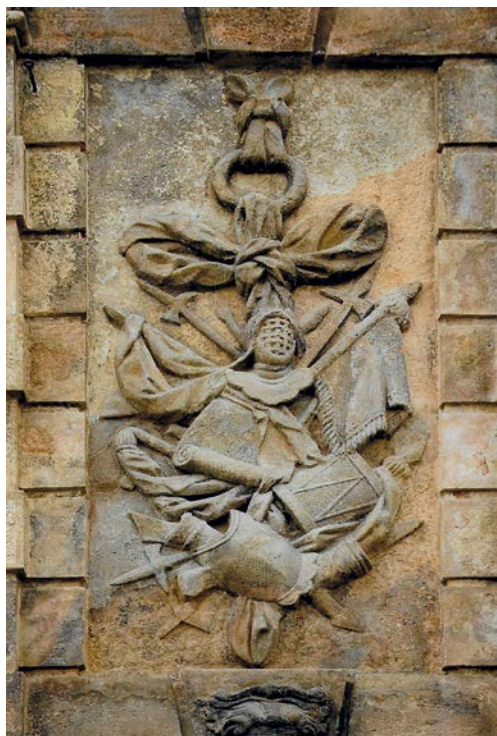
Reliéf na Písečné bráně v Praze

českých zemí a jejich vládci. Ostatně hned na tři z nich čekala na bitevním poli smrt. Hojně také zazníjí autentická svědectví kronikářů, letopisců či legendistů, především však samotných vojáků a jejich velitelů.