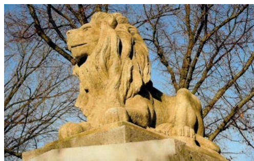
Památník obětem 1. světové války v Chotusicích

V pojmenování zahraničních lokalit dáváme přednost českým názvům. Kvůli snazšímu porozumění jsme přistoupili k nepatrným jazykovým úpravám dobových textů; několik bylo nově přeloženo. Pramenné citace vložené přímo do hlavního textu jsou odlišeny kurzívou .