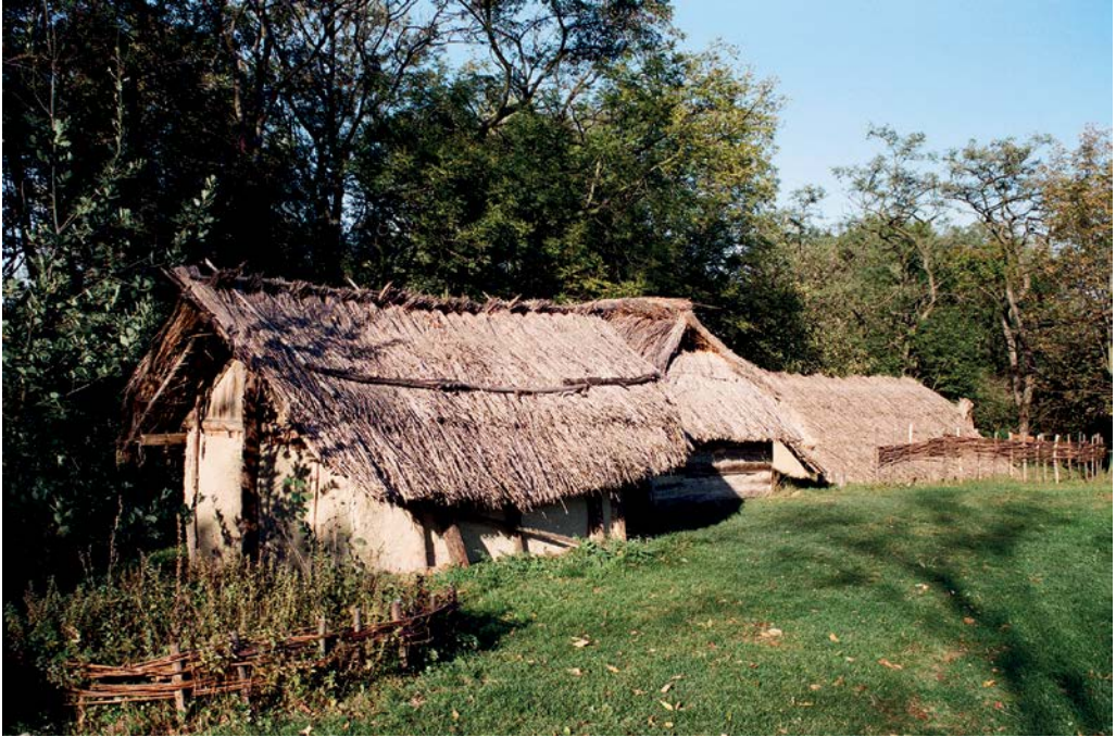
Skanzen v Březně

z Doupovských hor ke Krušnohoří, stejně tak cesty do středních a západních Čech.