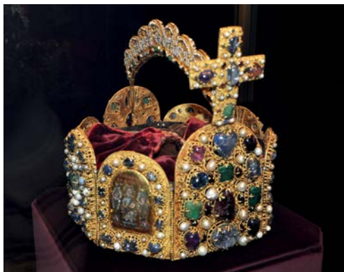
Koruna Svaté říše římské (10.–11. stol.)

Nesledujeme výhradně průběh bojů a vývoj vojenství, ale též celkové souřadnice a souvislosti s politickým vývojem