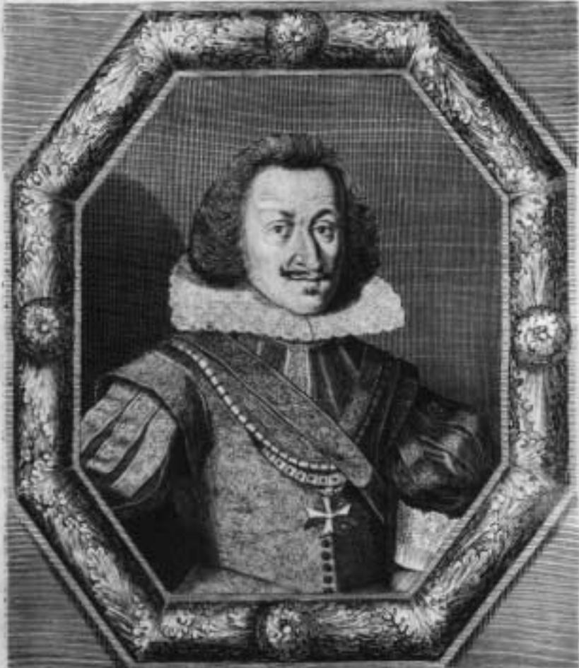
DON BALTASAR MARADA SE VIC. CONTE DEL S. R. I. COMMENDATORE DELL' ORDINE DI MALTA CASTELLANO D'AMPOSTA, GENT' DELLA CAMERA DI S. M. CES. CONS' DI STATO TENENTE GENERALE GENERALE DI BOEMIA CAP' DELLA GUARDIA D'ARCIERI DEL SUPREMO CONS' DI GUERRA DI S. M. CATT' SUO COLONELLO STIPENDIATO &c.