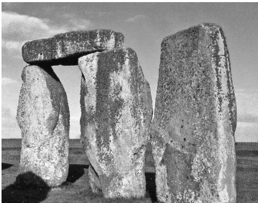
Trilit se vztyčeným kamenem

Trilit , jehož pojmenování pochází z řeckého „tri“ čili tři a „lithos“ neboli kámen, doslovně znamená „trojkámen“ či „tříkámen“. Je tvořen dvěma opracovanými vztyčenými kameny s kamenným překladem spojenými žlaby a čepy. Stojí o samotě. Představuje základní architektonický systém dvou pilířů a překladu, jemuž se říká architrávový. Nejvíce trilitů je v Bretani a z „trojkamenů“ je tvořena i část slavného Stonehenge. U nás zatím žádný trilit nalezen nebyl.