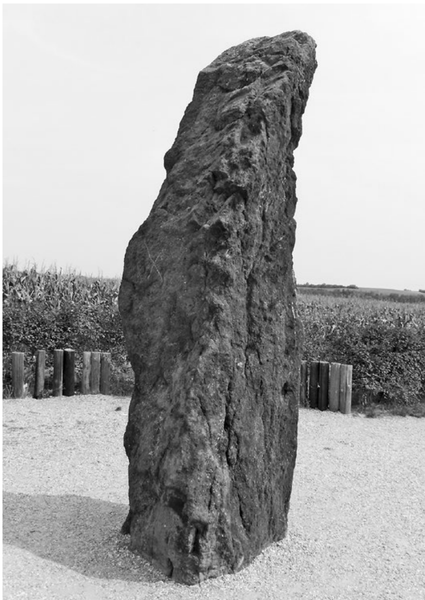
Náš nejznámější vztyčený kámen, Zkamenělý pastýř, stojí u Klobuk