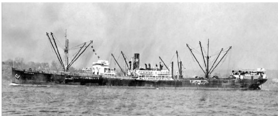
Na lodi Heffron se plavily dva legionářské transporty

vzpomínky/deník (příjezd do Neapole 13. března 1919). 23 Následoval Sheridan (14. dubna 1919, 100 mužů, příjezd do Brestu 7. července 1919), Nanking (15. června 1919, 1030 mužů, příjezd do Brestu 31. července 1917), Archer (24. června 1919, 1900 osob, příjezd do Brestu 15. srpna 1919), Liverpool Maru (9. července 1919, asi 600 lidí, příjezd do Marseille 12. září 1919), Meinam (4. srpna 1919, 400 mužů, příjezd do Marseille 10. října 1919), Heffron (13. srpna 1919, 880 mužů, příjezd do Terstu 17. prosince 1919), Karatchi Maru (3. října 1919, asi 1000 mužů, příjezd do Terstu 27. listopadu 1919), Capetown Maru (27. října 1919, asi 1100 mužů, příjezd do Marseille 16. prosince 1919), Italy Maru (22. listopadu 1919, asi 980 mužů, příjezd do Terstu 6. ledna 1920) a konečně Scotland Maru (25. listopadu 1919, zhruba 940 mužů, příjezd do Terstu 8. ledna 1920).