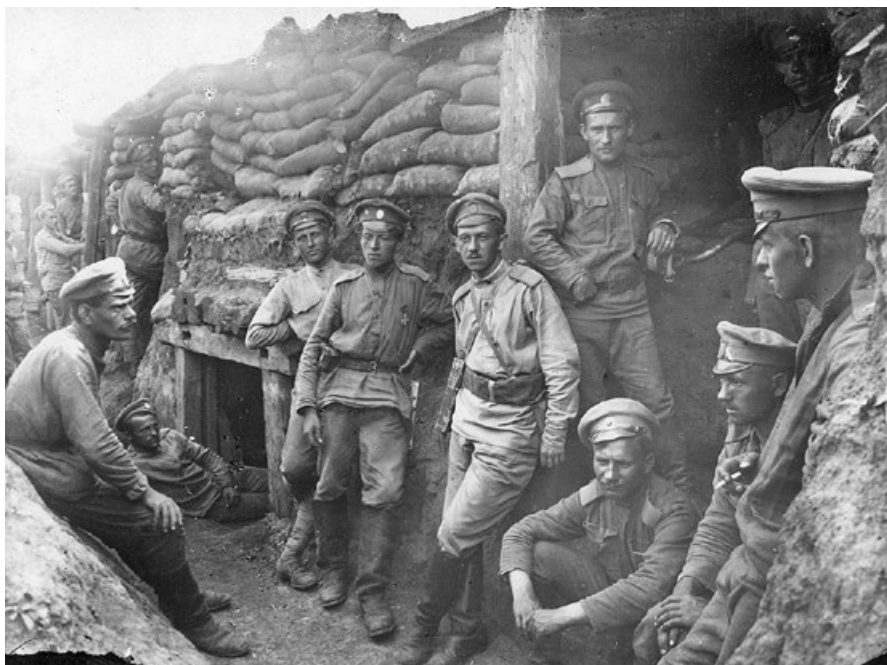
Príslušníci 3. roty 1. čs. střeleckého pluku v pozicích u Zborova krátce před bojem

Vzhledem k počtu nových dobrovolníků vznikla 17. dubna 1916 Československá střelecká brigáda , o necelý měsíc později zahrnovala struktura brigády dva střelecké pluky. Tím rozšiřování nekončilo, dne 15. března 1917