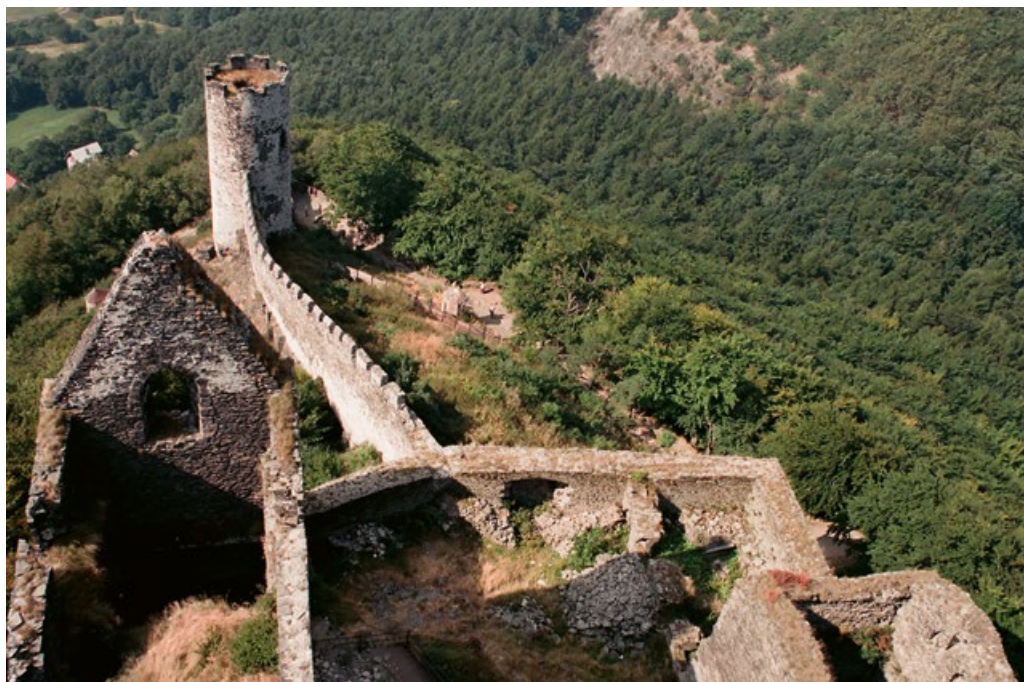
Pohled z hlavní věže

Když v roce 1283 opět Čechové spatřili svého mladého krále, měli vážné obavy o jeho zdraví. I podle průzkumu tělesných ostatků se zdá, že v dětství trpěl rachitidou, křivicí, vyvolanou nedostatkem vitamínu D: Byla tato rachitida způsobena skutečným zanedbáváním péče, nebo šlo o nezdravý základ mladého prince, který by byl vždy a za všech okolností neduživým dítětem? Patrně se to nikdy nedozvíme, i když leccos naznačuje, že šlo spíše o druhou z eventualit. (K. Charvátová)