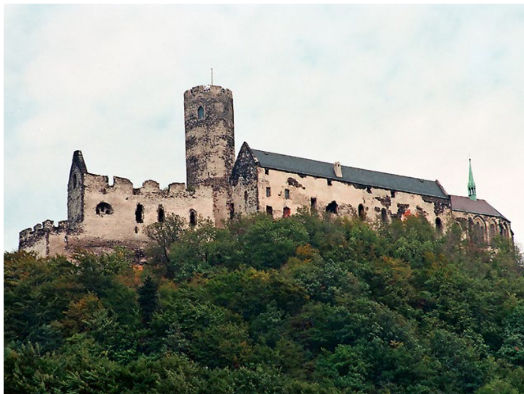
Hrad s hlavní věží (40 m), palácem a kaplí (vpravo)

Ptejme se tedy na motivy autorů zkusit Václavovo zajetí jen těmi nejtemnějšími odstíny. Historikové poukazují na to, že první kniha kroniky byla zamýšlena jako oslavný spis legendistického charakteru. Měl podpořit snahu svatořečit krále coby dobrodince církve, jenž založil též zbraslavský klášter, v němž brzy po jeho smrti začali sepsovat svou kroniku.