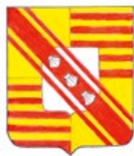
Erb vévodů Beaufort-Spontin