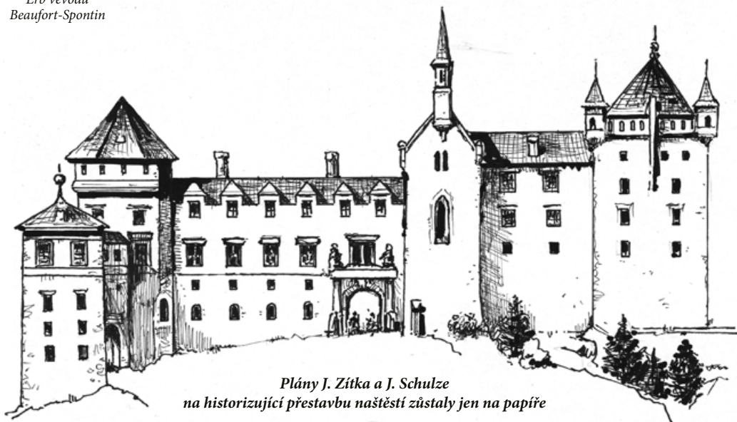
Plány J. Zítka a J. Schulze na historizující přestavbu naštestí zůstaly jen na papíře

První písemný záznam o hradě je až z roku 1349 ve spojení s pány z Oseka, později psaných z Rýzemberka. Hrad vznikl snad už před koncem předchozího století, jak by ukazoval oválný bergfrit. Brzy byl ale rozšířen o dvě výrazné čtyřhranné věže (donjon a kaple s gotickými freskami) a ještě později o nový palác. Své stopy zanechala v mohutnějším areálu též renesance a baroko, kdy byly přidány další zámecké budovy. Státní hrad a zámek, ležící v chráněné krajinné oblasti Slavkovský les, prezentuje zámecké interiéry a zvláště unikátní relikviář.