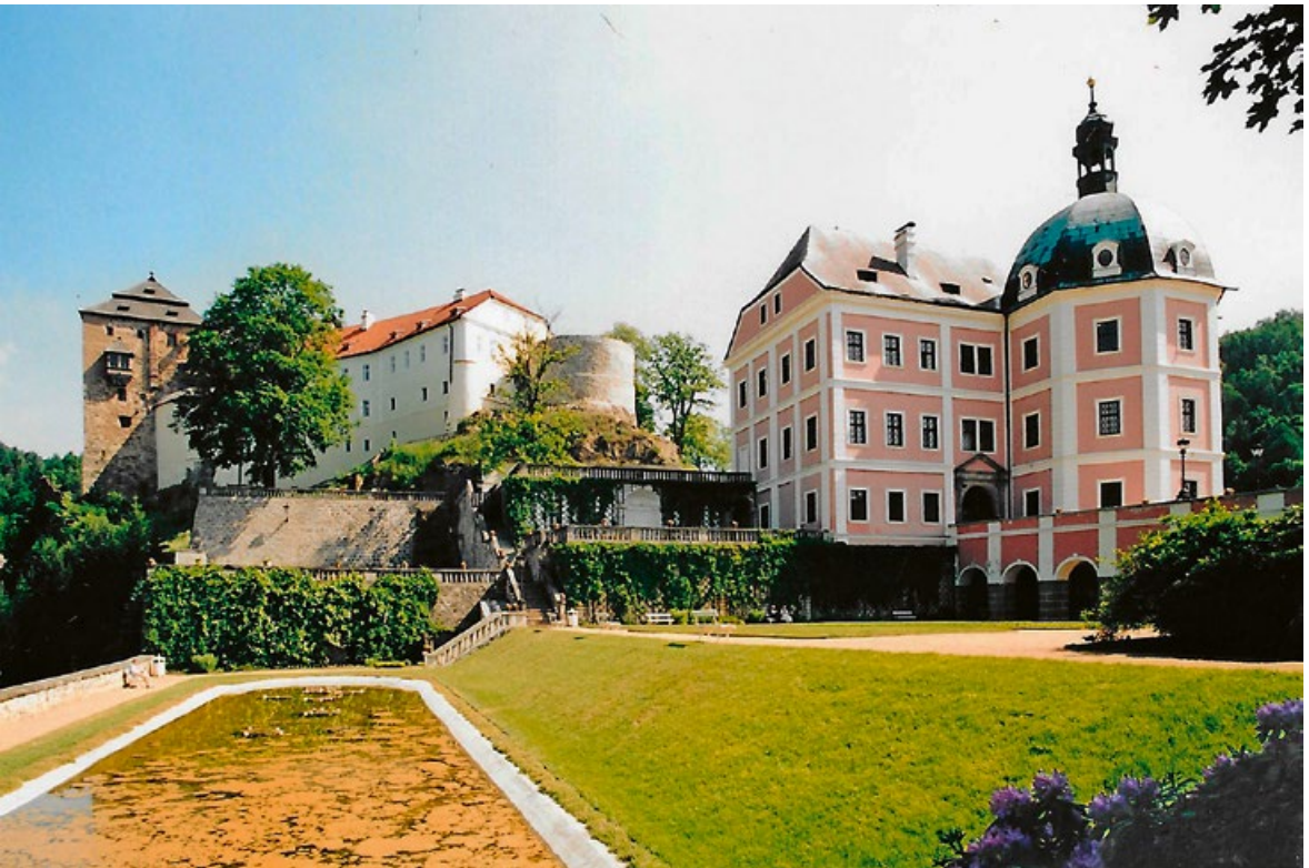
Hrad a zámek

Archivní poznatky mnoho neprozradily, tým vyloučil spoustu slepých uliček; tipovaly se rodiny, které ji mohly do Čech přivést (Američan potvrdoval, že věc nepochází z naší země) – snad by mohlo jít o rod Mens-