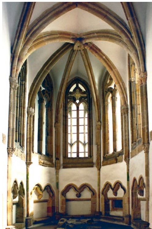
Kaple sv. Michaela, dokončená za vlády Václava II.

Přes tyto handicapy Václav vyrostl ve skvělou vladařskou osobnost a přemyslovské skráně ozdobil hned třemi královskými korunami.