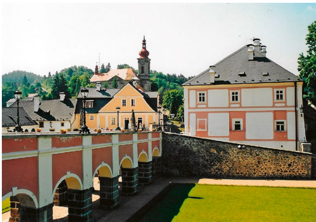
Pohled ze zámecké zahrady k městečku

dorff-Pouilly, Metternich nebo Beaufort-Spontin. Čas letěl neuvěřitelným tempem. Ministerstva zahraničí, financí i kultury, vedena vidinou valutové měny, proti vývozu neznámé památky neprotestovala a v září 1985 byl domluven listopadový termín podepsání příslušných smluv. Československá strana si přitom vymínila podíl 25 % z prodeje, Douglasem odhadovaného na 4 miliony dolarů!