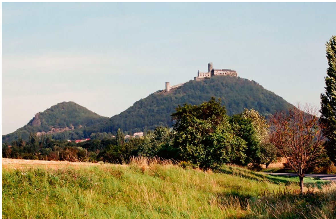
Charakteristické panorama bezdězských kopců

Ota správu země nezvládal; v situaci se orientoval těžko a pokusy o tvrdou politiku vyvolávaly nespokojenost, navíc se nedokázal domluvit ani s královnou-vdovou Kunhutou. Avšak postavení správce země a Václavova poručníka, byť dočasné, bylo silným lákadlem. Stejně zjevné ovšem bylo, že pokud si má udržet nějaký vliv, musí mít v rukách kralevice.