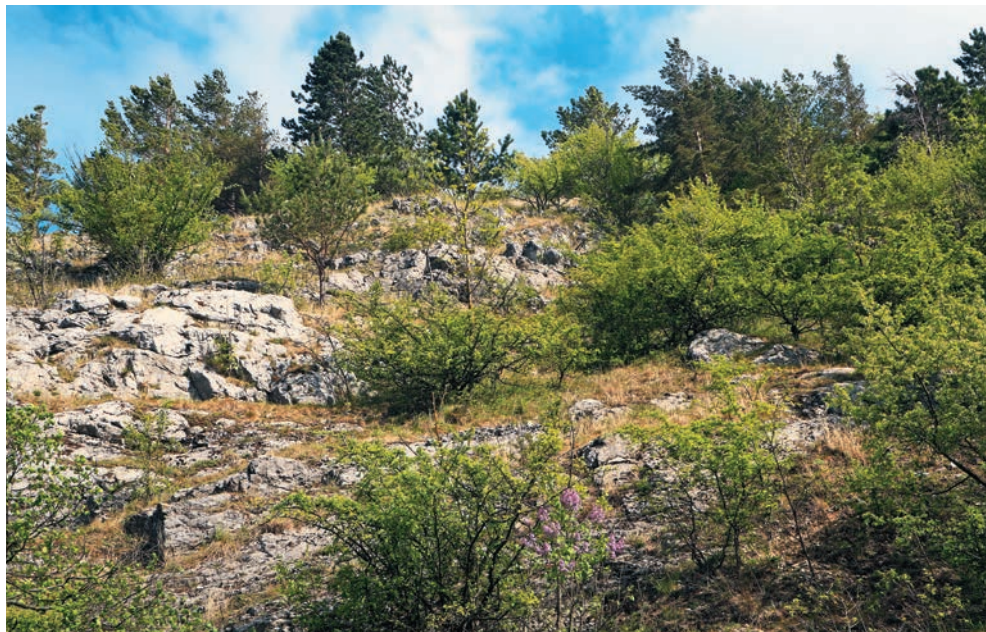
Kršlenica v Mokrej doline