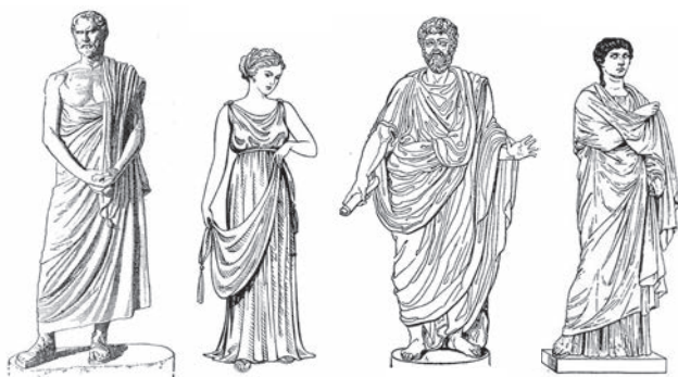
Zľava doprava: grécky muž zahalený do plášt'a (himation), grécka žena v tunike (chitón), rímsky muž v tóge a rímska matróna v plášti (palla).

Inšpirovaní barbarskými jazdcami začali vojaci slúžiaci v chladných podnebiach nosiť krátke vlnené alebo kožené nohavice. Niektorí čoskoro urobili ďalší logický krok a začali nosiť dlhé nohavice. Ich velitelia nasledovali: a cisár z 3. storočia šokoval slušnú verejnosť tým, že mal také nohavice (a blond'avú parochňu) na sebe, keď viedol svoje vojsko. 3