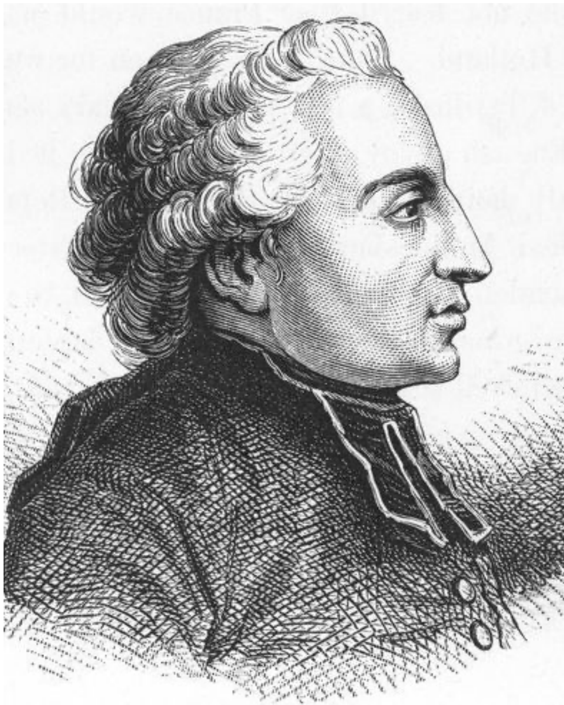
Abbé Sieyès, dřevoryt z 19. století, autor neznámý.