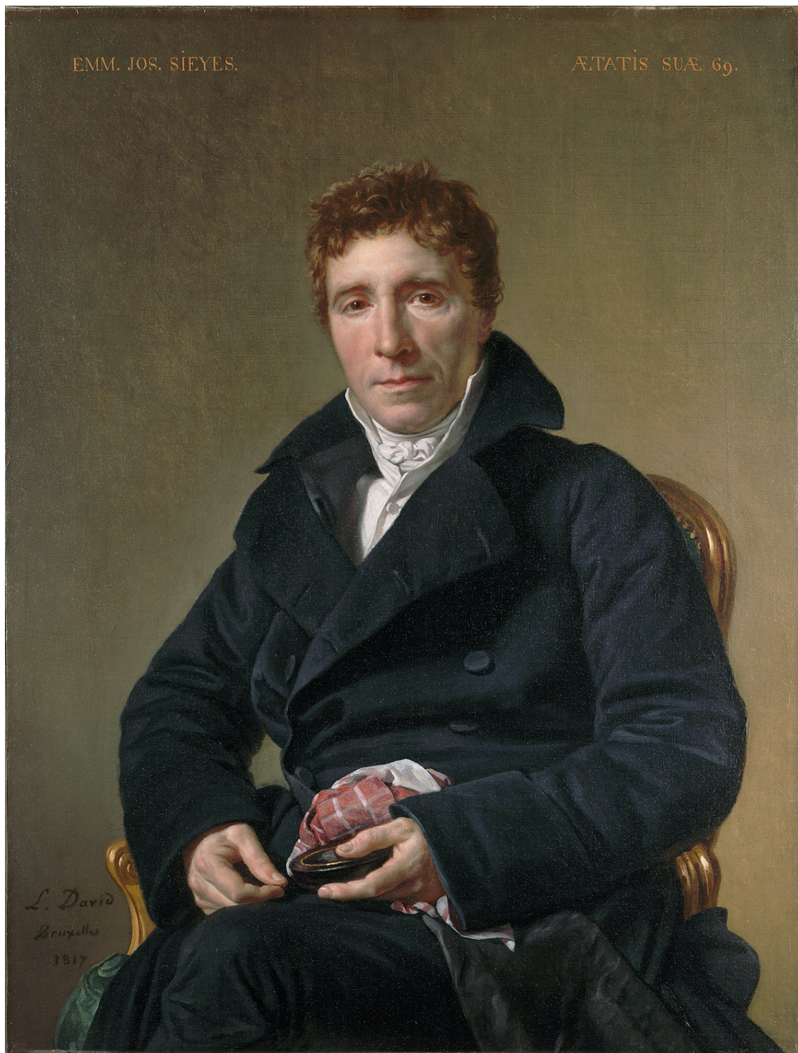
Nejznámější Sieyesův portrét od slavného malíře Jacquese-Louise Davida, který byl vytvořen během Sieyesova a Davidova exilu v Bruselu v roce 1817.