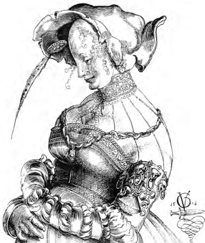
Hezká dívka, kresba Urse Grafa z roku 1515. Neurvalý, ale jinak oblíbený umělec signoval svá díla monogramem a znakem meče.