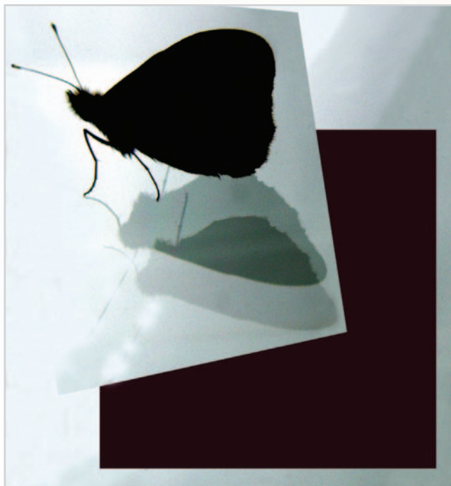
Obrázek 1.6: Víme, že jde o motýla, má tedy věcnou roli. Díraz je však kladen na roli výtvarnou, která převažuje u všech prvků ve snímku.