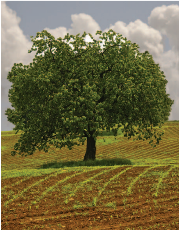
Obrázek 1.11: Fotogeničnost a symetrii stromu stojícího o samotě, podtrhuje porost ve tvaru zelených líní.