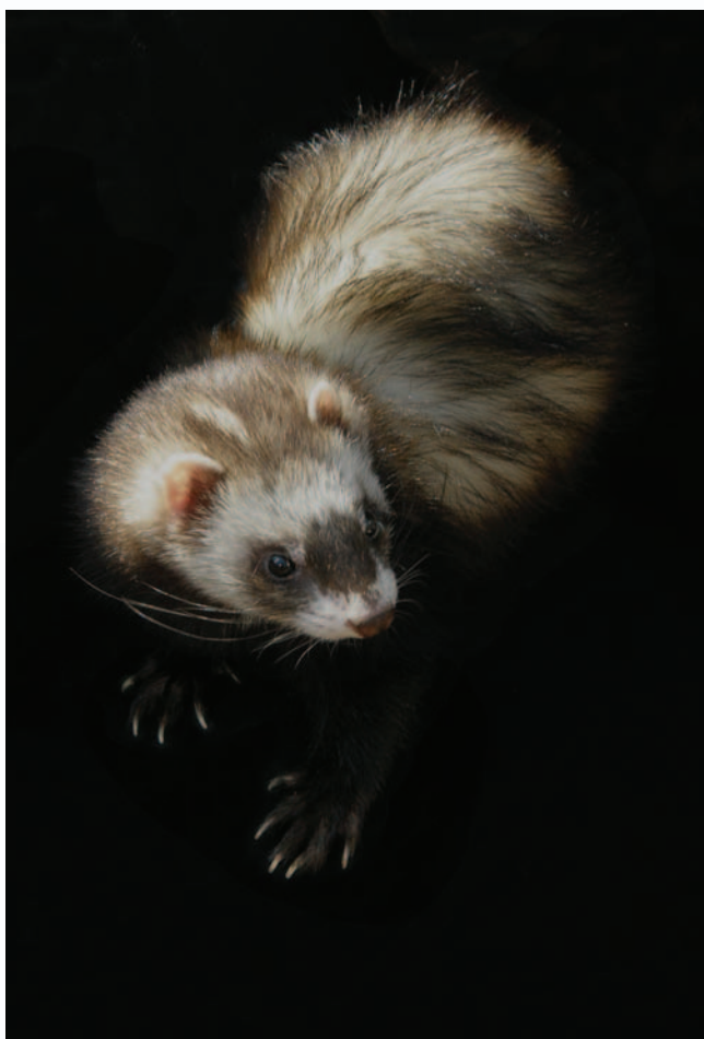
Obrázek 1.9: Světlá fretka na tmavém pozadí s patrnou texturou kožičku. Její dráčky jsou důležitým prvkem, neboť na nás přímo číhají.