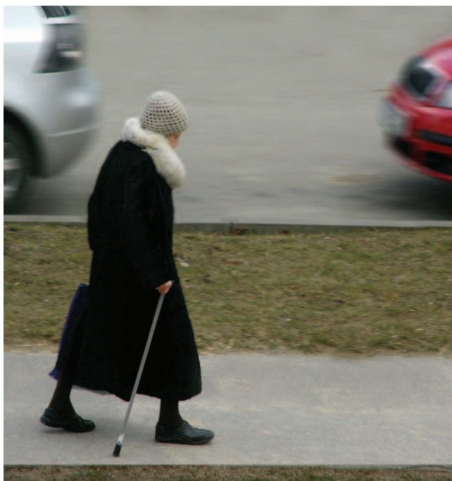
Obrázek 1.7: Ve skutečnosti nemá paní s auty nic společného. Ve snímku s ní tvoří obrazové prvky. Je na divákovi, jak si jejich vztah vysvětlí.