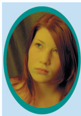
Obrázek 1.5: Portrét tvoří detail, který považujeme za uzavřený celek.

Princip role je uváděn jako základní kámen pro uspořádání prvků, tedy kompozici fotografického obrazu, která podporuje obsah snímku. Je-li prvek v obraze sám, je jeho role jiná, než když je součástí celku obrazu, kdy jednotlivé prvky vytvářejí vztah mezi sebou navzájem a mají vztah i k rámu obrazu.