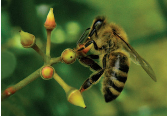
Obrázek 1.10: Prvky jsou rozmístěny po celé ploše obrazu. Včelu vyvažuje několik drobných květů.