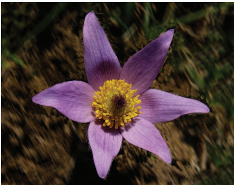
Obrázek 1.1: Figurou je reálný a ostrý květ.

Figura nemusí být na snímku celá, ale divák by měl mít možnost si její pokračování domyslet, pokud je to k pochopení obsahu snímku vůbec třeba.