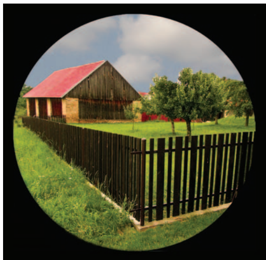
Obrázek 1.3: Polocelek krajiny, jebož rámovou symetrií narušuje rytmizace linií.