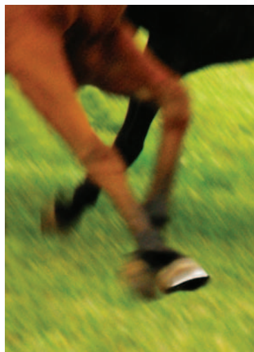
Obrázek 1.4: Ostrá část kopyta je zkratkou, která s dalšími prvky navozuje trysk koně.