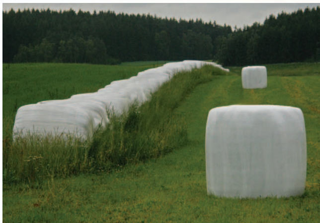
Obrázek 1.8: Nejblížejší balík sena je měřítkem, umožňujícím odhadnout vzdálenost ostatních balíků i celé sestavy, tvořící šikmou linii a podporující prostorové uspořádání.